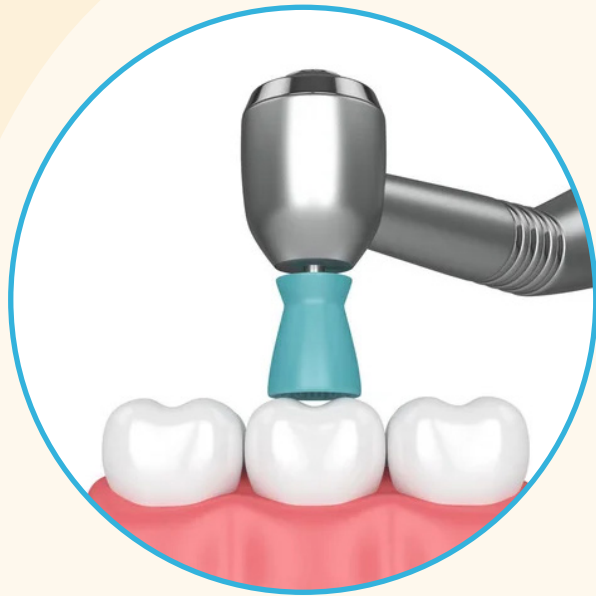
El pulidor dental